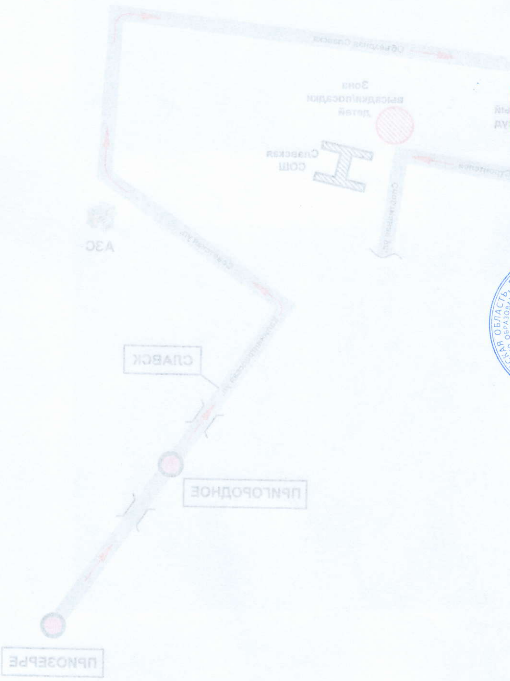
Схема движения школьного автобуса по маршруту Славск - Пригородное - Приозерье и обратно

7 (авг) 2016 Листов и мм.ч. 1 УТВЕРЖДАЮ Директор В.И. Киселева